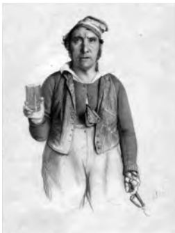
Der rote Schiffer Lithographie um 1850